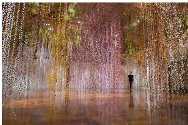
Installationsansicht Community , 2018 Toledo Museum of Art, Ohio, USA

Natur feiern in der Stadt. Unter diesem Motto findet vom 3. Februar bis 7. Oktober im kommenden Jahr das Flower Power Festival München 2023 statt. Die Kunsthalle München, der Gasteig, Europas größtes Kulturzentrum, der Botanische Garten München-Nymphenburg und BIOTOPIA – Naturkundemuseum Bayern sind die Impulsgeber des stadtweiten Festivals, bei dem alle mitmachen können, ob große Institutionen, kleine Verbände, renommierte Kultureinrichtungen oder private Initiativen.